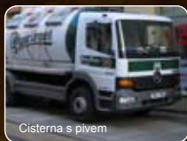
Cisterna s pivem

“Samovýčepní pивní bar (2S2B) poskytuje návštěvníkovi nezapomenutelný zážitek - natočit si sám své pivo . Sami si rozhodnete o velikosti pěny - a to kdykoliv, bez čekání . Spotřeba (výtoč) piva může být měřena pro každého zákazníka samostatně , bez ohledu na to, kolik hostů kolem jednoho stolu sedí. Navíc informační systém 2S2B umožňuje spojení barů 2S2B mezi sebou v reálném čase, ať jsou kdekoli na světě, takže můžete příteli v jiném baru poslat zprávu nebo mu zaplatit pivo ... To je skutečně možné.”